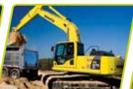
Vejesystem til gravemaskiner