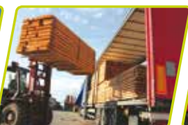
Vejesystem til gaffeltrucks