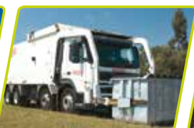
Vejesystem til skraldebiler