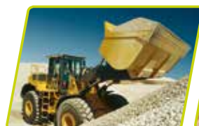
Vejesystem til gummihjulslæssere